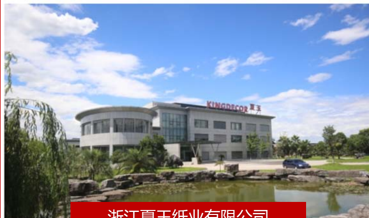
浙江夏王纸业有限公司