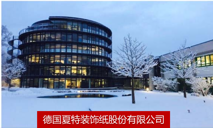
德国夏特装饰纸股份有限公司