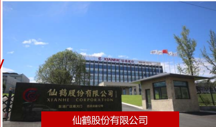
仙鹤股份有限公司